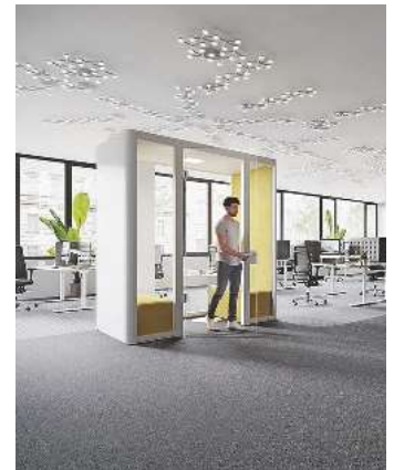
/ Quiet.Box Duo: Meetingbereich für zwei Personen mit minimalem Platzbedarf.

mit transparenter Glasrückwand, und zwei Formsprachen, geradlinig und organisch, fügt sie sich harmonisch in die vorhandene Raumarchitektur ein. (hf)