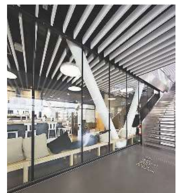
/ Bauaufsichtlich geprüft: rahmenlose Ganzglaswand von Promat.

wände F1 sind absturzsichernd sowie bis zu 90 min feuerwiderstandsfähig. (hf)