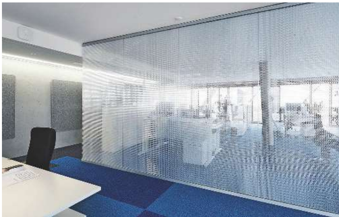
/ Die schallschirmenden Elemente Kandela T38 ermöglichen den Mitarbeitern eine partielle Durchsicht, geben Sichtschutz und reduzieren die Schallausbreitung.

Für die akustische Optimierung der Räume der LVM Versicherung in Münster lieferte der Herforder Kunststoffspezialist Wacosystems ihre transparenten Wabenpaneele Kandela T38. Die Paneele wirken schallschirmend durch Reflexion des Schalls in Richtung der absorbierenden Elemente. Als Kernmaterial dient eine Wave-Core-Wabe